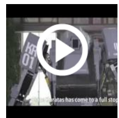
Il robot da pilotare come in un cartoon