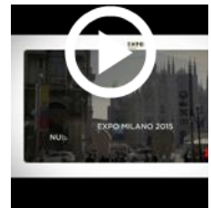
A Expo il Parco della Biodiversità